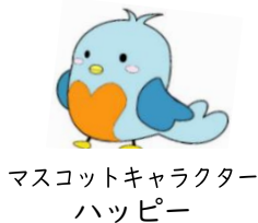
マスコットキャラクター ハッピー